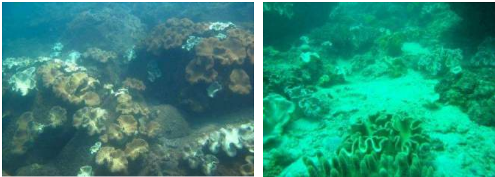
Hình 2. Ưu thế về độ phủ của giống san hô Sclerophytum ở Cù Lao Chàm (trái) và sự đa dạng về thành phần các loài san hô tám ngón ở Lý Sơn (phải)

12 m (ở độ sâu này trung bình độ phủ đạt 16 %). Đặc trưng phân bố của san hô ở Cù Lao Chàm là phân bố trên nền đáy là các khối đá tảng với độ phủ khá cao, ở nền đáy là cát thô và cát bùn chúng phân bố theo các tập đoàn đơn lẻ. Một số khu vực rạn ngầm có độ sâu > 20 m như Rạn Lá, Rạn Mành giống san hô Sclerophytum và nhóm san hô sừng kích thước nhỏ chiếm ưu thế về độ phủ [17]. Chi tiết vào từng điểm khảo sát cho thấy, khu vực Bãi Bắc và Bãi Bìm san hô mềm phân bố đến độ sâu 6 m, Hòn Khô và Vũng Bến Lãng đến 8 m, Vũng Cây Chanh, Vũng Đá Bao và Vũng Thùng phân bố đến độ sâu 10 m, Vũng Ráng và Bãi Đầu Tai phân bố đến 12 m. Bãi Đầu Tai và Vũng Cây Chanh san hô mềm phân bố khá đều ở những độ sâu khác nhau, các điểm khác như Hòn Khô, Vũng Ráng, Vũng Thùng, Bãi Bắc độ phủ san hô mềm tập trung cao ở 4 m sau đó có xu hướng giảm dần theo độ sâu. Những điểm còn lại sự thay đổi về độ phủ san hô mềm không theo quy luật mà phụ thuộc vào đặc điểm của nền đáy. Nghĩa là, ở những nơi có nền đáy cứng là đá tảng hoặc nền san hô chết là giá bám thuận lợi cho san hô mềm phát triển.